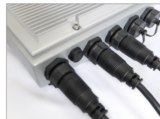
プロテクションPC用IP67ケーブル も使えます