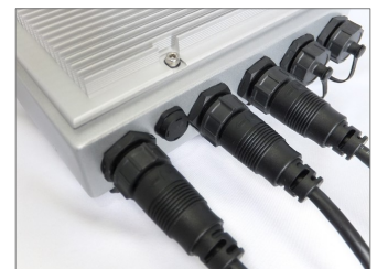
プロテクションPC用IP67ケーブル も使えます