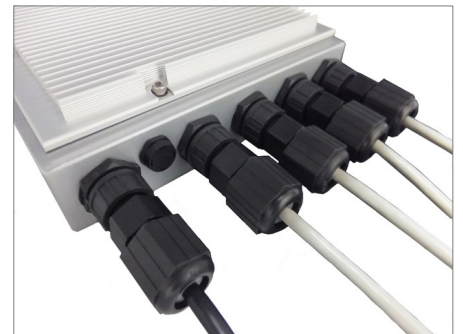
エクステンション・コネクタと一般的なPoE対応LANケーブル