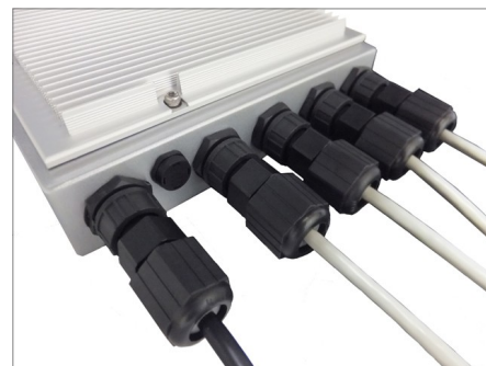
エクステンション・コネクタと一般的なPoE対応LANケーブル