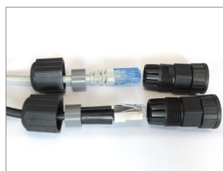
エクステンション・コネクタ 分解（組み立て方）