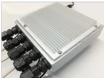
水に濡れても大丈夫