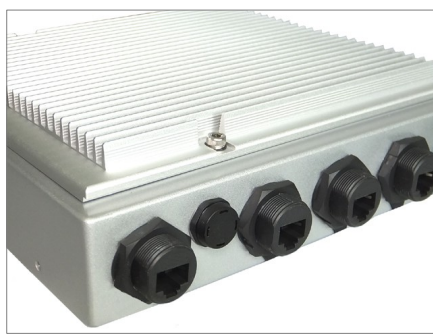
エクステンション・コネクタを使用すれば一般的なLANケーブルが使えます