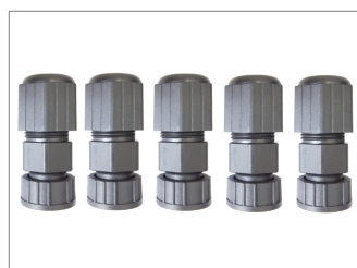
エクステンション・コネクタ 5個付属しています