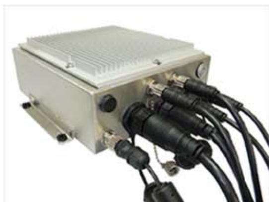
各ケーブルを取り付けたところ