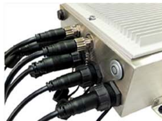
耐食性に優れたナイロンプラスチック製コネクターを採用