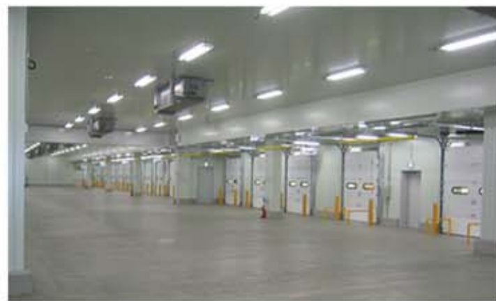
倉庫・物流 (大規模倉庫・物流倉庫・冷蔵倉庫など)