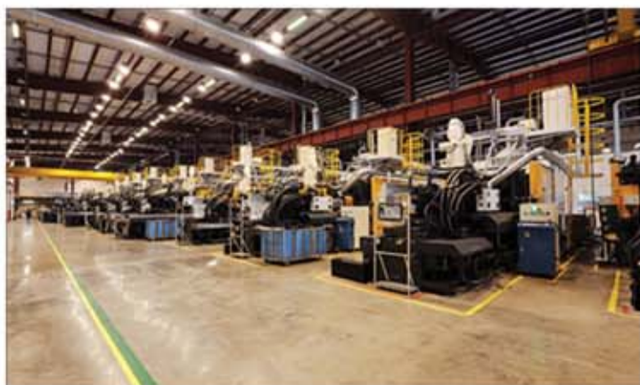
製造工場 (製鉄・鉄工・電機など)