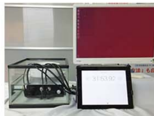
30 分間の水没テスト