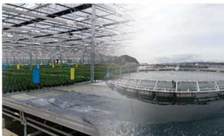
先進的農業・漁業 (植物工場、品種改良、魚種選別・養殖など)