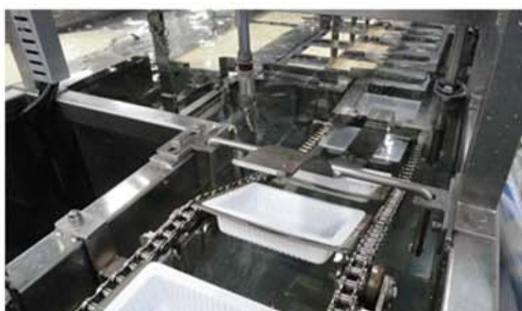
食品加工 (水産加工・食品洗浄・選別など)