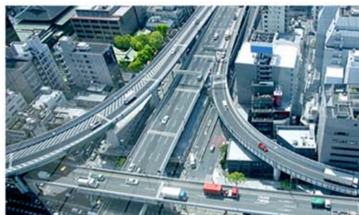
社会インフラ (道路・橋脚・トンネル・交通・船舶など)

今までは エッジコンピューティング・フォグコンピューティングとして、過酷で劣悪な環境で使える PC がありませんでした。 「エムテクション PC」は「 今まで PC を置きたくても置けなかった環境・現場 」に設置して、 使い続けることが出来る、日本初の 完全密閉型防塵防水 PC です。