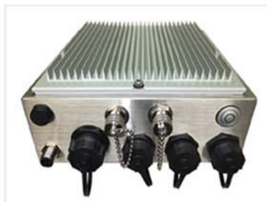
ロストフリット正面