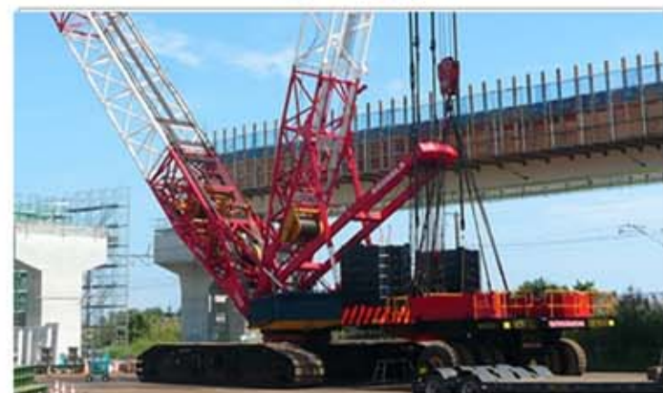
特殊車両 (クレーン・フォークリフト・道路検査車など)